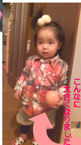
こんなに大きくなりました

は、「によなにやなあー…○△×□♪♪」解読不能のごきげんな独り言を言いながら、もくもくとクレヨンを走らせます。時にはテレビや窓にも色を付けてくれます!ボールペンの髭を作りながら「あははははは」と笑っている娘を見ると、私も笑ってしまいます。娘は、たくさん笑顔を送ってくれます。私も、くもった顔をしてはいけないと改めさせられます。ヤンチャ娘バンザイ!!